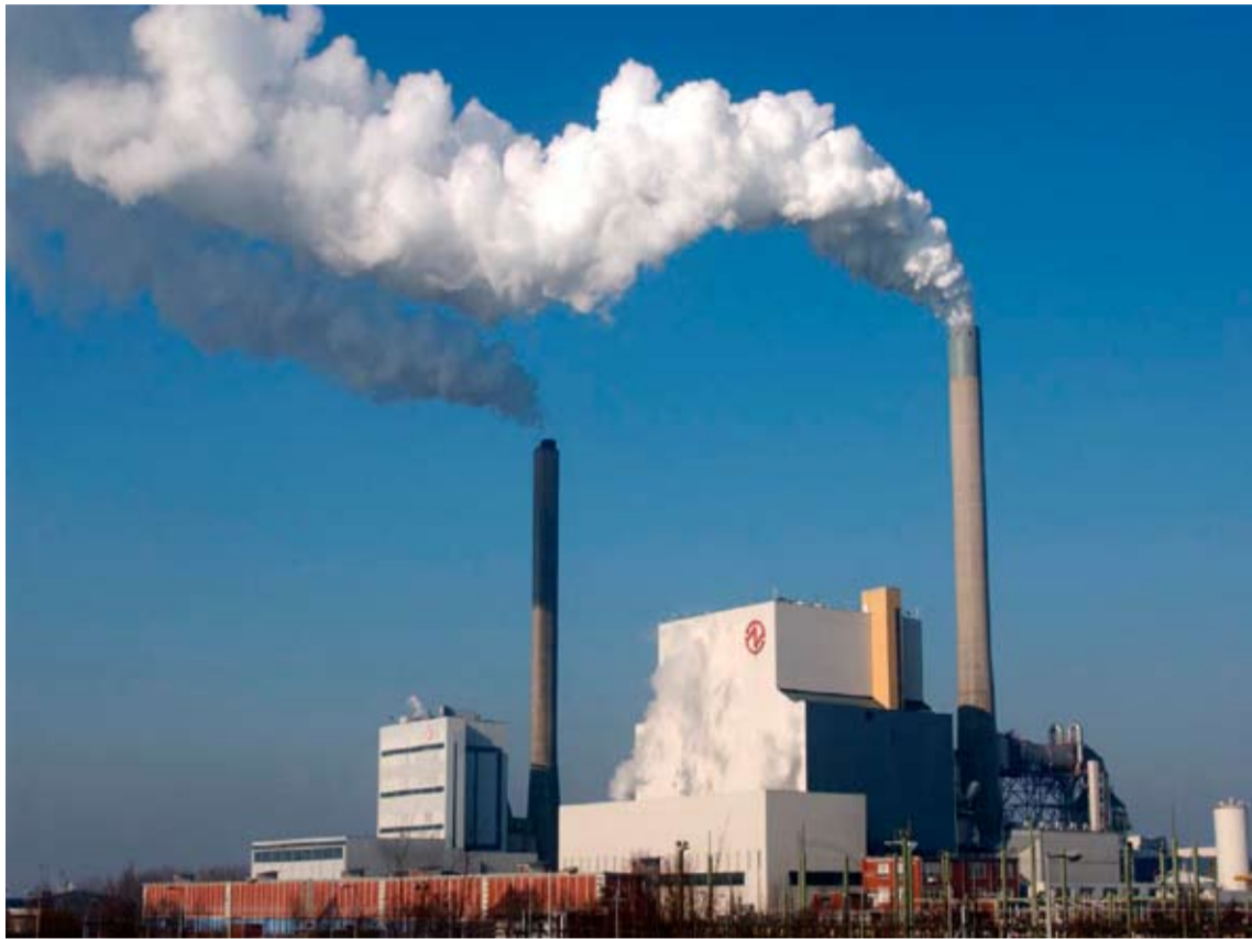
Hemwegcentrale: de grote cv-ketel voor Amsterdam-Noord

In de Banne krijgen de nieuwbouwwoningen stadsverwarming.