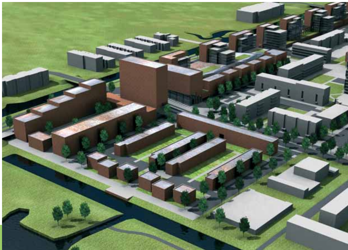
De plannen voor de Kadoeler Breek in beeld ontwerp door RPHS architecten