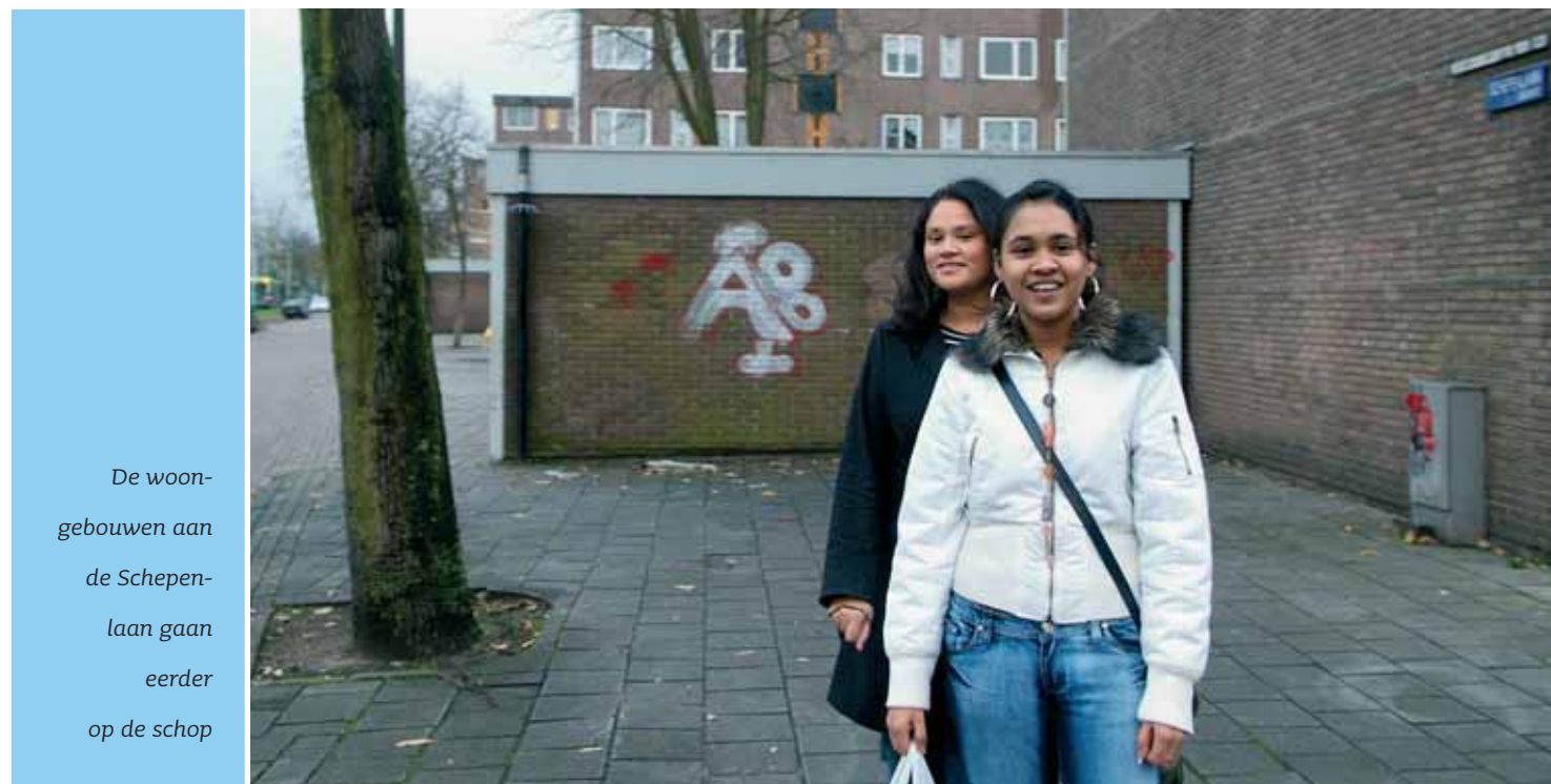
De woon- gebouwen aan de Schepen- laan gaan eerder op de schop