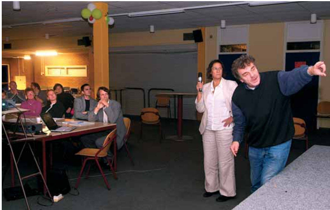
Discussie op vergadering over het Marjoleinterrein

In het Plan van Aanpak van de Banne staat voor het gebied Marjoleinterrein en omgeving dat op deze plek ongeveer 102 woningen moeten komen.