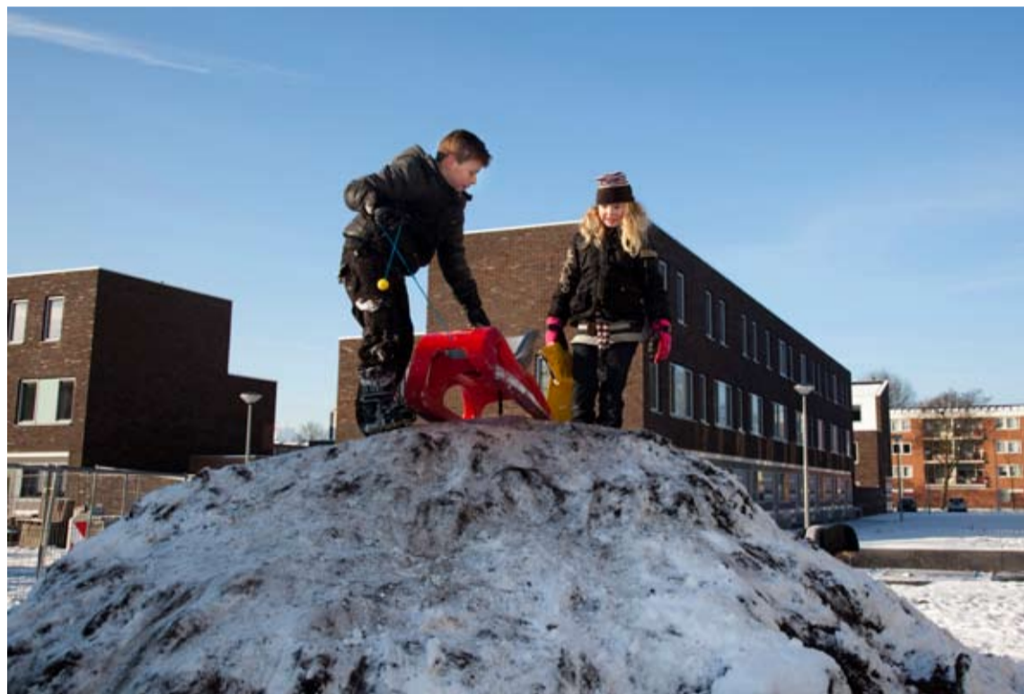
Bij de nieuwbouwwoningen in 'De Kaapstander'