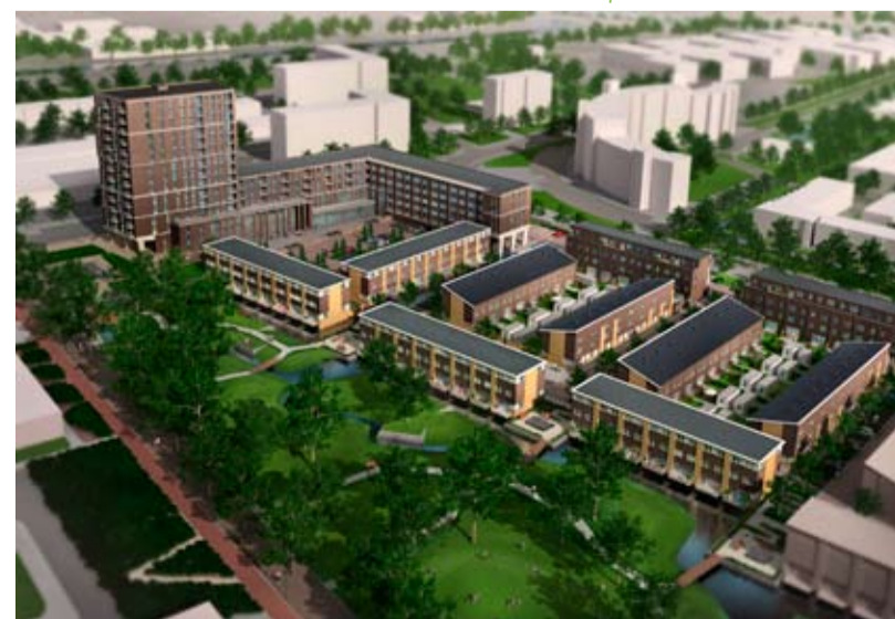
Impressie van de nieuwbouw

In 2006 is onderzoek verricht naar vleermuizen in de Banne. In dat onderzoek is naar voren gekomen dat er in de Banne als geheel niet veel vleermuizen zijn, behalve in het Koopvaardersplantsoen. Het Koopvaardersplantsoen is een foerageergebied voor vleermuizen. Vleermuizen eten voornamelijk insecten zoals muggen. Er zijn veel opmerkelijk veel dwergvleermuizen aangetroffen. Deze dwergvleermuizen zijn overigens volstrekt ongevaarlijk voor mensen. Er zijn vooruitlopend op de sloop van de woonblokken langs de Schepenlaan nieuwe geschikte plekken in de zogenaamde spouwmuuren aan de overzijde van het Koopvaardersplantsoen gemaakt. Nu blijkt dat deze plekken volop door de vleermuizen gebruikt worden en dat er zelfs in de zomer een kraamkolonie heeft gezeten. Al met al een vruchtbaar resultaat voor de vleermuis in uw buurt. <