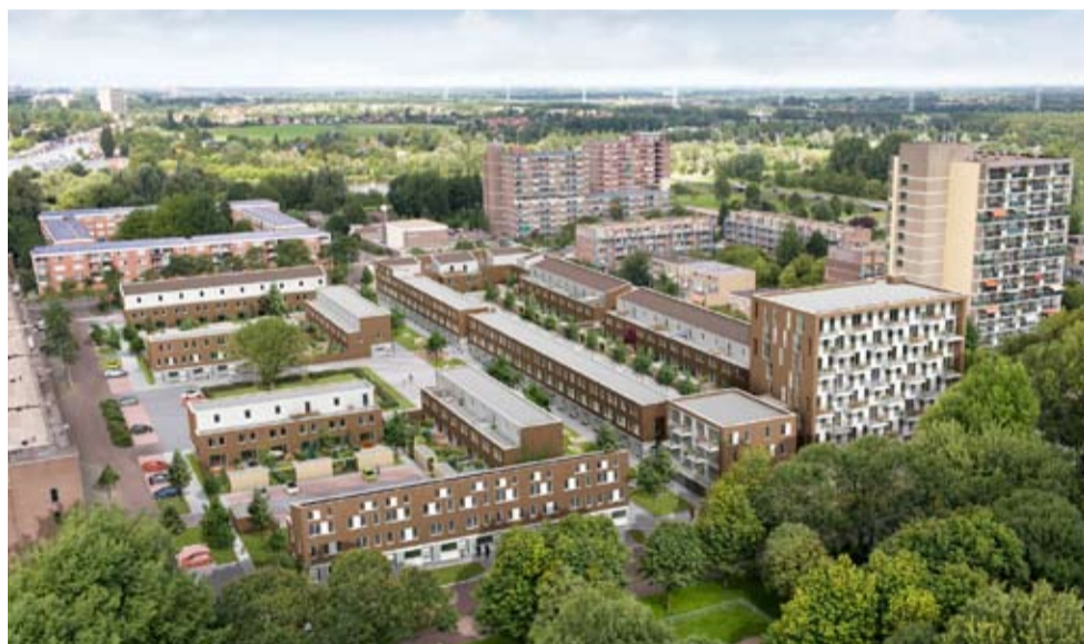
Impressie van de nieuwbouw tussen de bestaande bouw

De start van de woningbouw in de Banne is ook het begin van de invoering van stadswarmte voor woningen in stadsdeel Amsterdam-Noord. De Kaapstander is de eerste nieuwbouw die wordt aangesloten op stadswarmte. Ymere en het stadsdeel vinden duurzaamheid belangrijk en investeren hierin. Stadsverwarming draagt onder andere bij aan het verlagen van de uitstoot van CO 2 . <