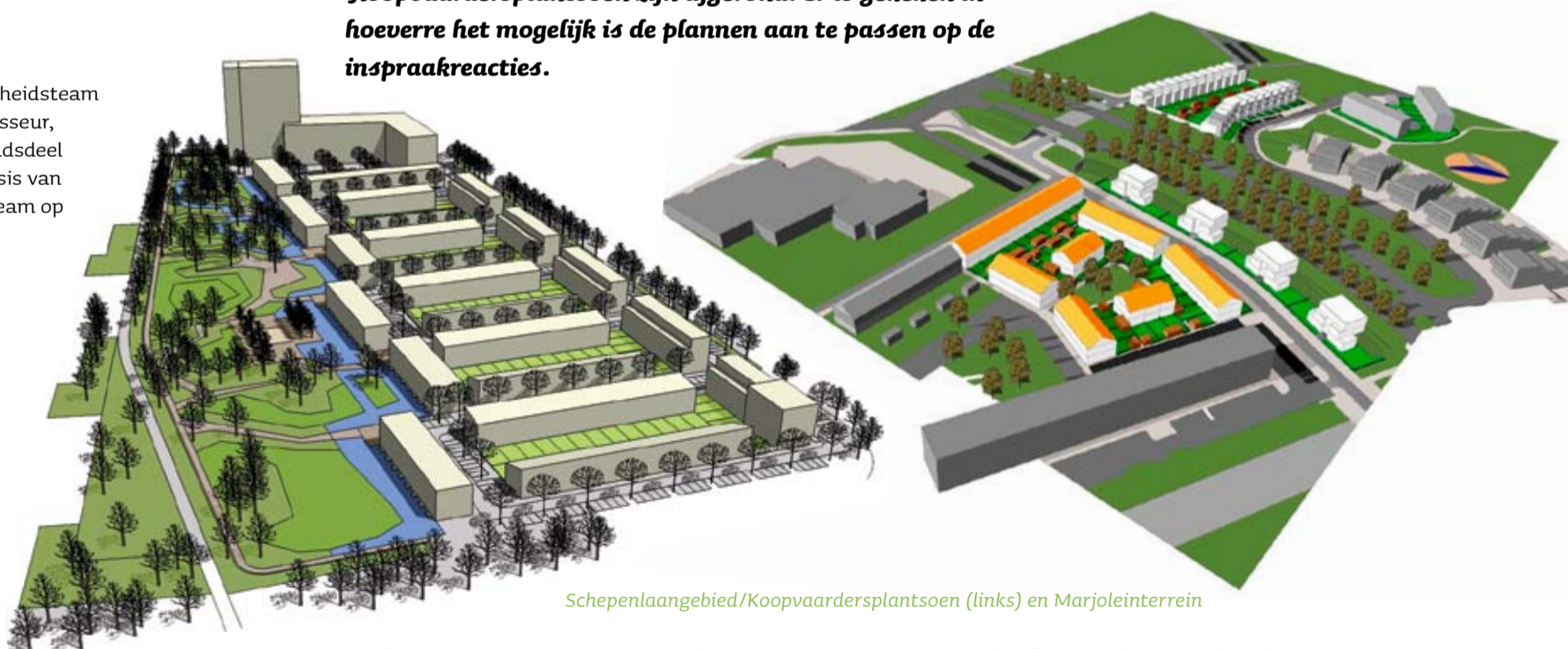
Schepenlaangebied/Koopvaardersplantsoen (links) en Marjoleinterrein

De inspraakperiodes van de stedenbouwkundig plannen voor het Marjoleinterrein e.o. en het Schepenlaangebied/Koopvaardersplantsoen zijn afgerond. Er is gekeken in hoeverre het mogelijk is de plannen aan te passen op de inspraakreacties.