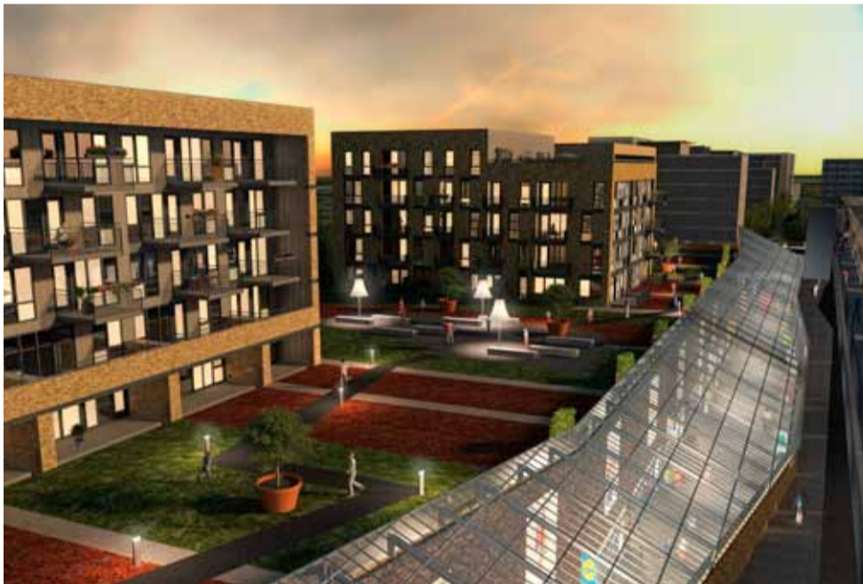
Een groot deel van de woningen kijkt uit op de daktuin. Ook de winkelpassage is van bovenaf goed zichtbaar.

De bouw van Banne Centrum, het nieuwe wijk- en winkelcentrum van de Banne, gaat vliegensvlug. Op het dak van een naastliggend gebouw is een webcam geplaatst die 24 uur per dag live de voortgang van de bouw in beeld brengt. Wilt u de bouw live volgen, dan kan dat via: www.bannecentrum2013.nl/banne-webcam .