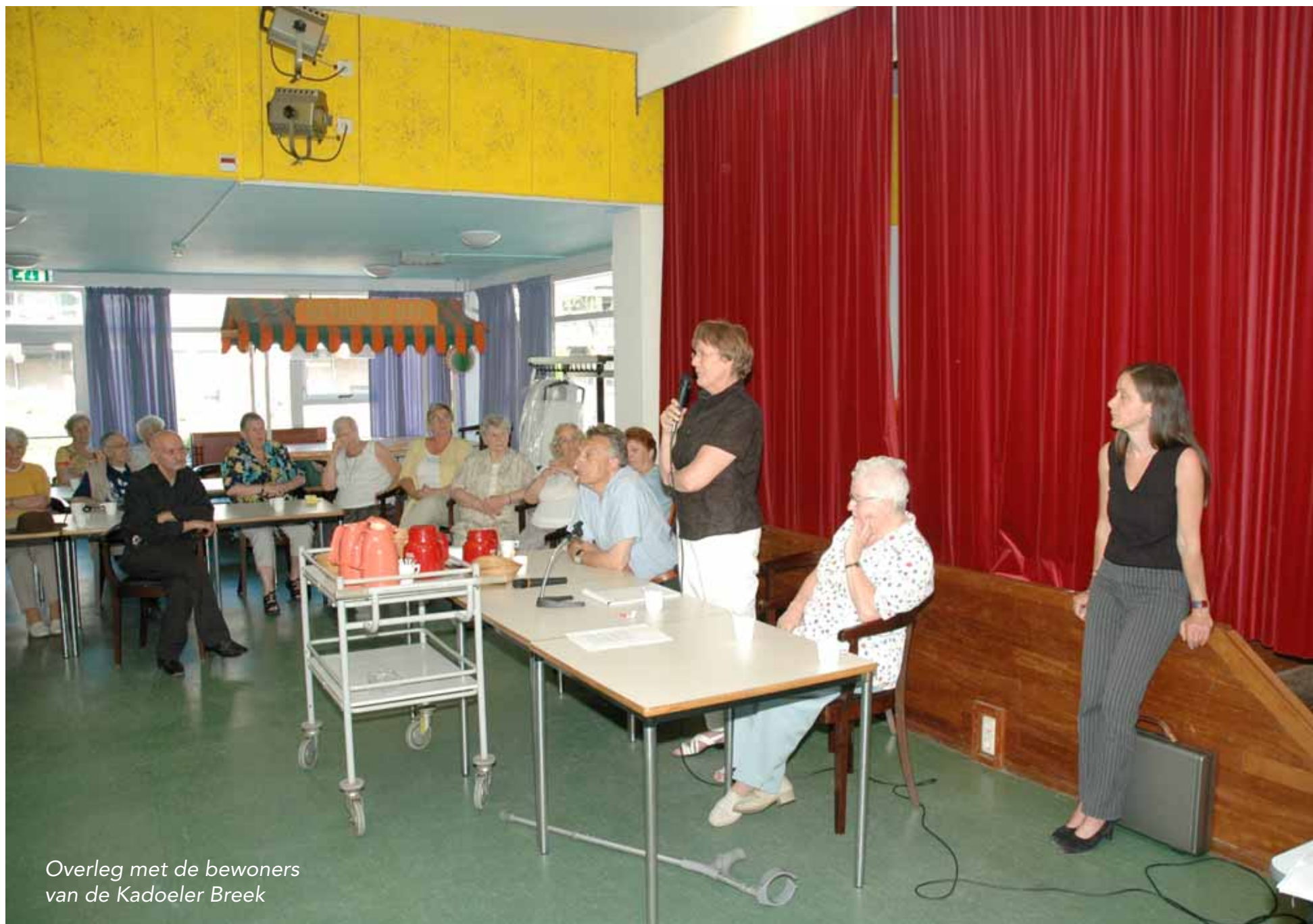
Overleg met de bewoners van de Kadoeler Breek