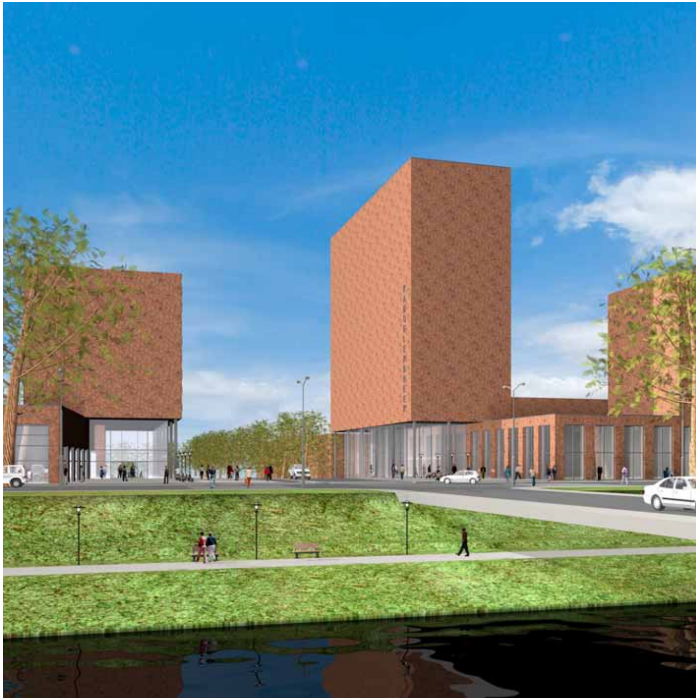
Zicht op Kadoelerbreek vanaf Westerlengte