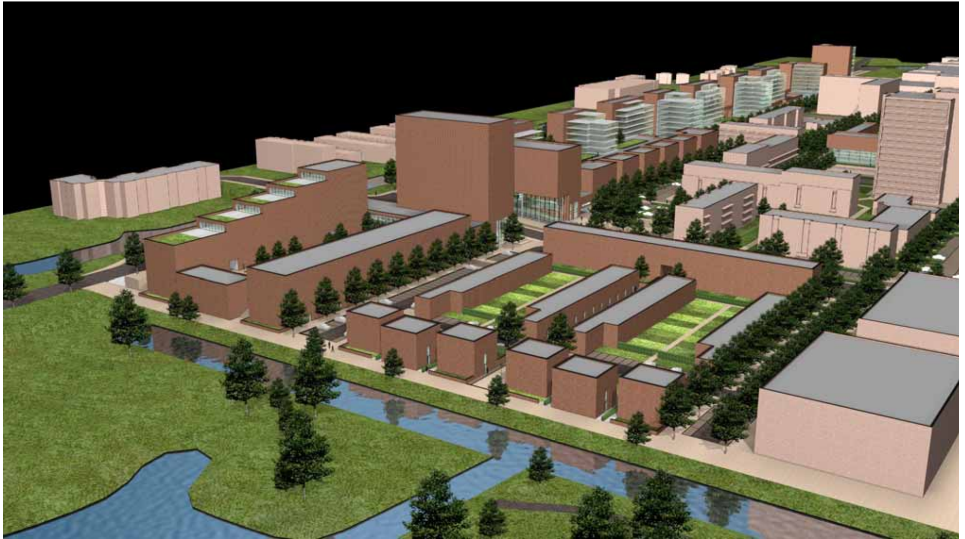
Stedenbouwkundig plan Kadoelerbreek