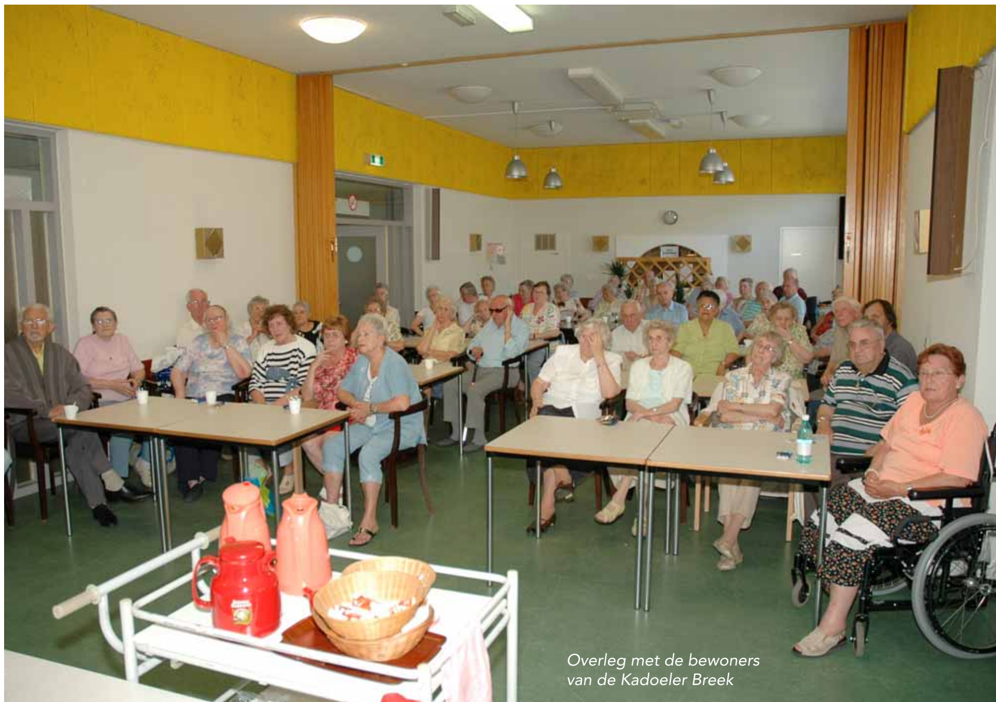
Overleg met de bewoners van de Kadoeler Breek