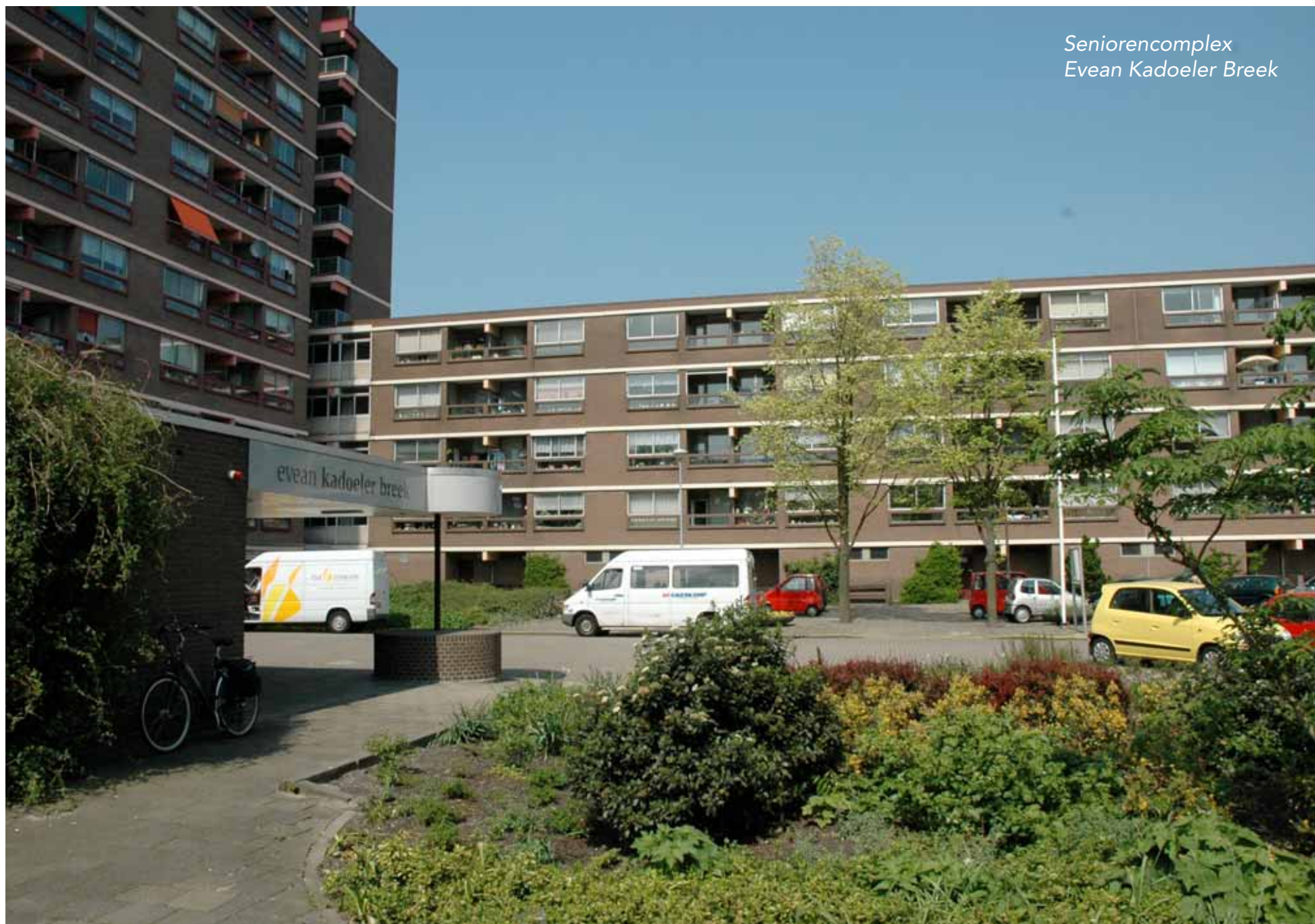
Seniorencomplex Evean Kadoeler Breek