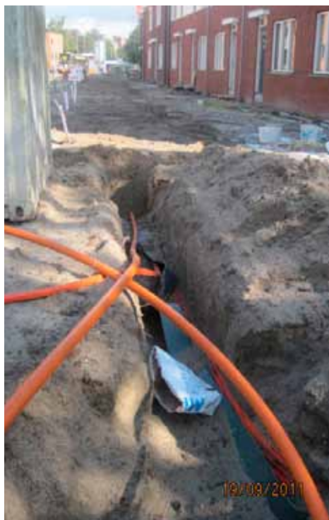
Aanleg op het Marjoleinterrein

op het milieu. Bovendien verbruikt glasvezel voor het datatransport aanzienlijk minder energie. Tenslotte betekent de aanleg van glasvezel een daling van het kopergebruik. En daarmee ook van de milieubelastende koperwinning. Glasvezel is met andere woorden dus ook groen.