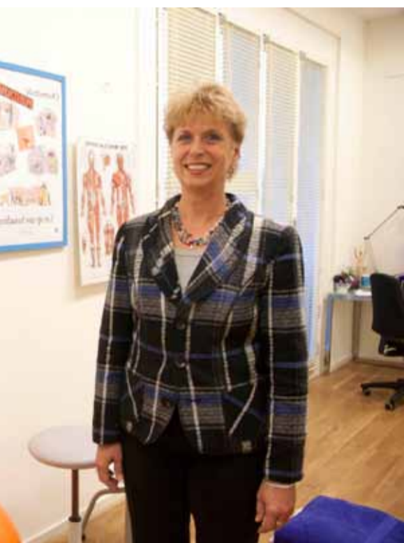
Praktijk Oefentherapie Mensendieck

tegen een geringe betaling, kunt uitbesteden in onze dienstenwinkel. Cordaan is er voor mensen die zorg en begeleiding nodig hebben. Als het kan komen we bij u thuis of u bezoekt ons in het dienstencentrum Kadoelbreek.